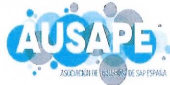
imagen de marca de ambas y respete los grafismos sin alteraciones. Cualquier otro uso por una de las Partes de las obras y activos de la otra sujetos a derechos de propiedad intelectual o industrial requerirá autorización expresa y por escrito para cada caso concreto otorgada por la entidad titular de los correspondientes derechos.

3.2. La formalización del presente Acuerdo no implica la existencia de asociación o creación de ningún tipo de entidad conjunta de colaboración, de tal forma que ninguna de las Partes podrá obligar y vincular a la otra en virtud de este documento y permanecerán independientes entre sí, sin que medie relación alguna de representación o vinculación legal o laboral.